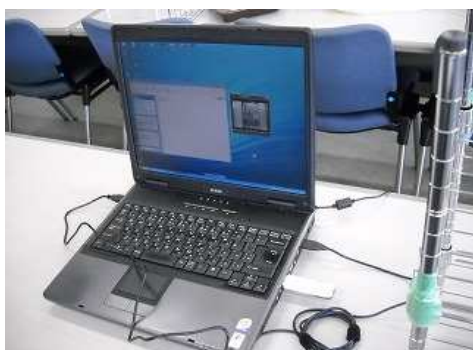
リモートパソコン